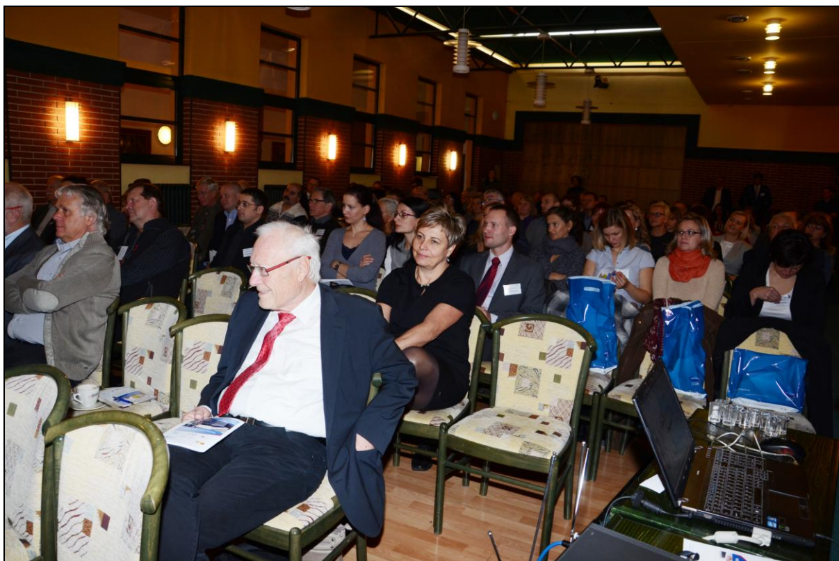
Obr. 7: Auditorium