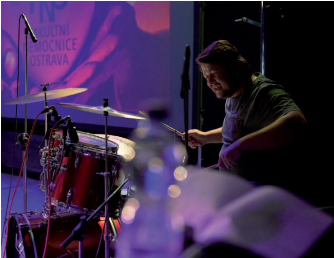
Setkání v Divadle Mír provázel i rozmanitý kulturní program.