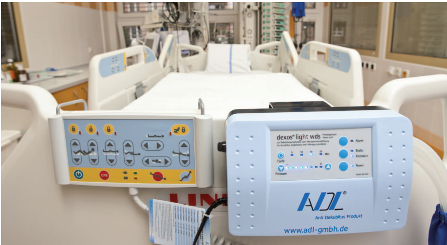
Ilustrační foto dokumentuje atmosféru JIP.

V srpnu byla ve čtyřech boxech metabolické jednotky intenzivní péče (JIP) a ve dvou boxech transplantační JIP Interní kliniky Fakultní nemocnice Ostrava instalována nástěnná klimatizační zařízení, která pomohla vyřešit potíže způsobené