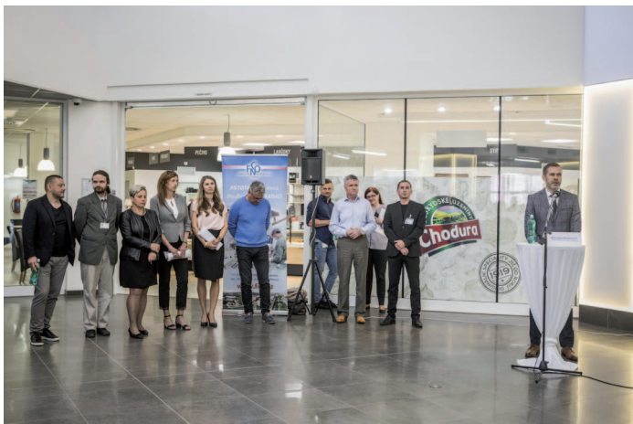
Zaměstnanci se potkali s nově jmenovaným ředitelem i jeho nejužším týmem.