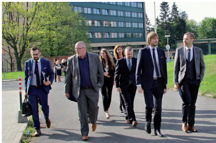
Při první návštěvě ministra zdravotnictví ve FNO vedla jeho cesta napříč areálem.