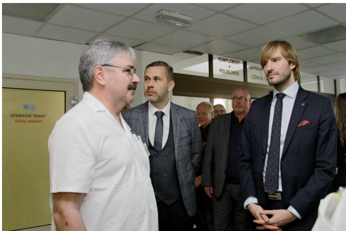
Ministr zdravotnictví Mgr. et Mgr. Adam Vojtěch navštívil kromě jiného také urgentní příjem, s jehož chodem se blíže seznámil.