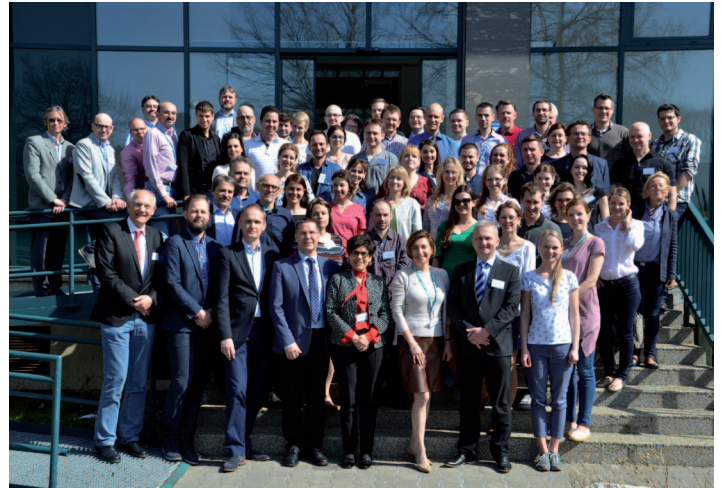
Účastníci workshopu 2018

Operace se přenášely kvalitním zařízením s pohledem zevně na operátora a pacienta, z mikroskopu a endoskopu a v průběhu komentovaných operací probíhala interaktivní debata mezi operátorem a účastníky workshopu. Odpolední teoretické bloky prvního dne workshopu se věnovaly diagnostice premaligních lézí hrtanu, významu optických endoskopických metod, léčbě časných karcinomů hlasivek a papilomatóze hrtanu. Druhý odpolední program byl věnován glotickým stenózám hrtanu (přední a zadní) i subglotickým stenózám hrtanu a průdušnice, které podnítily širokou diskusi o možnostech a limitech těchto výkonů.