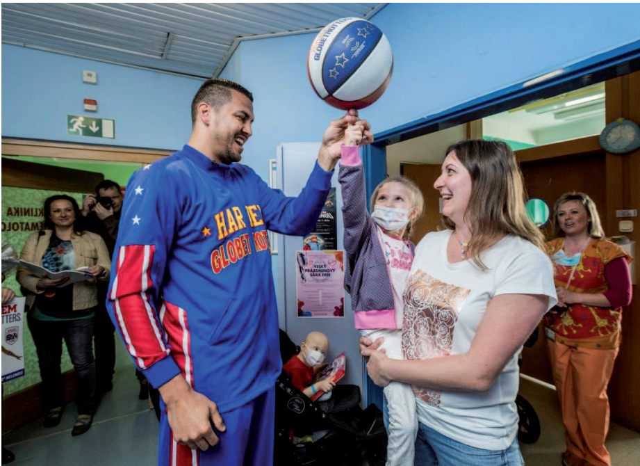
Ve čtvrtek 5. května zavítal za dětskými pacienty člen basketbalového týmu Harlem Globetrotters.