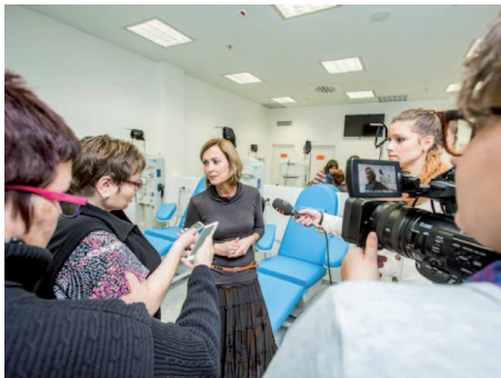
Otevření odběrového místa v netradičním prostředí zaujalo média.