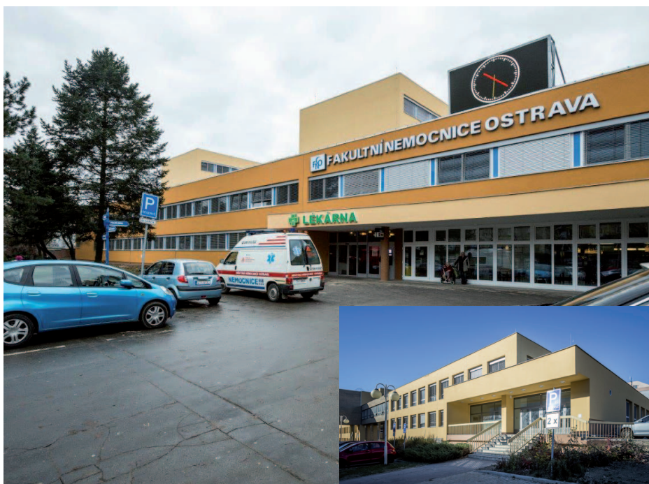
Moderní a kvalitní nemocnice na první pohled.

V roce 2015 prošla Fakultní nemocnice Ostrava výraznou změnou exteriéru.