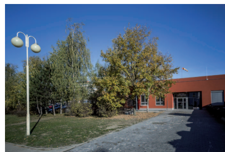
Svou podobu změnil k lepšímu i objekt, v němž sídlí patologie.