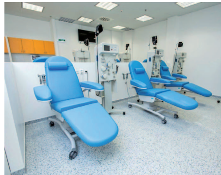
Je zde šest odběrových míst

Detašované pracoviště Krevního centra FNO je zaměřeno pouze na odběr plazmy a vymezeno pro dárce, kteří už prošli odběrem krve nebo dárcovským odběrem plazmy, takže mají status kvalifikovaného dárce. Důvodem je nezbytnost vysoké úrovně odběru a zajištění naprosté bezpečnosti dárce i kvality vyráběných transfuzních přípravků. Pracoviště je v provozu od pondělí do pátku od 9 do 19 hodin a nastaveny jsou zde čtyři odběrové cykly dopoledne a čtyři odpoledne s polední pauzou. Dárci se mohou objednat v krevním centru na půdě fakultní nemocnice, k odběru plazmy se pak dostaví do ostravského Avion Shopping Parku.