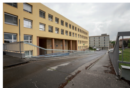
Zrekonstruovaná budova diagnostického centra.