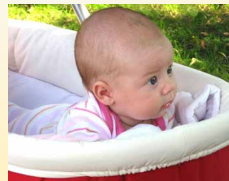
V lehu na břiše se opírá o lokty a drží hlavičku. Pokud mu v této pozici ukážete hračku, bude ji sledovat zrakem.