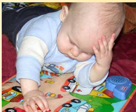
Prohlížejte si s dítětem knížky s velkými výraznými ilustracemi.