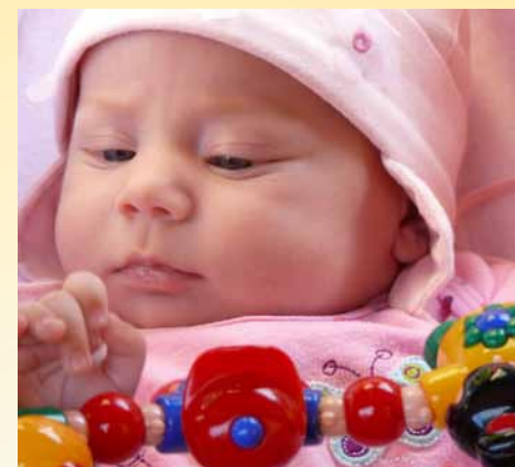
Sleduje zrakem barevnou hračku.