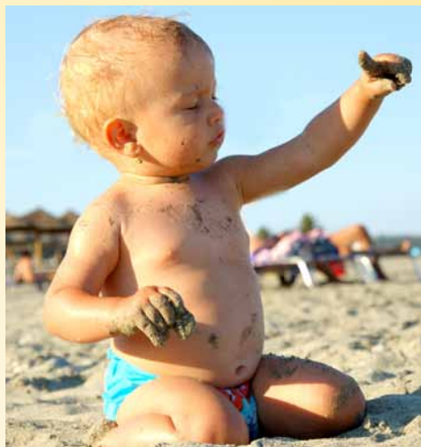
K lepšímu poznávání světa je důležité se zašpinit.

pinzetový úchop palcem a ukazovákem. Knoflíky musí být velké, aby je dítě nespolklo!