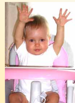
„TAK JSEM VELIKÁ“