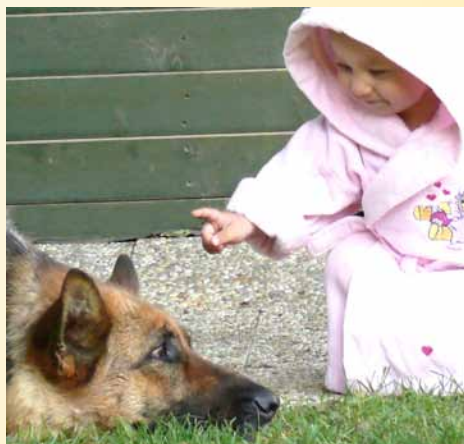
„TO JE HAF“