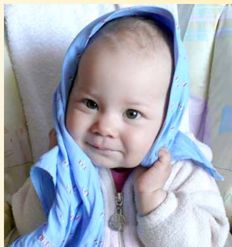
Rozumí hře „KUKU“ nebo „BAF“.