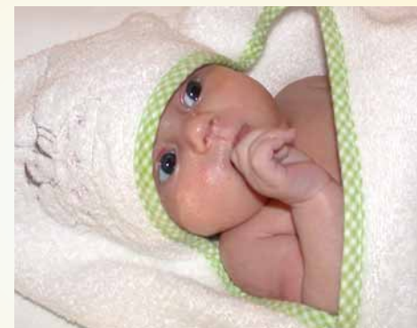
V lehu na zádech udrží hlavičku rovně ve středu a snaží se dávat ruce do pusy.