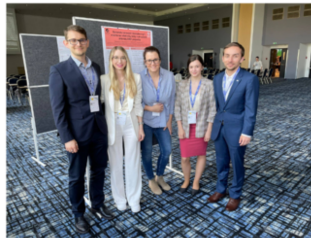
Jedličkovy dny 2022