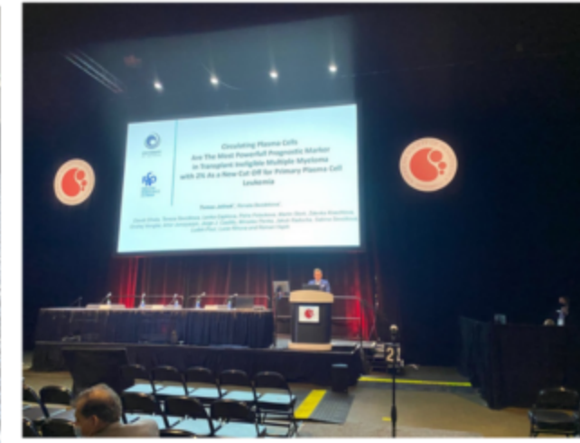
Přednáška ASH 2022