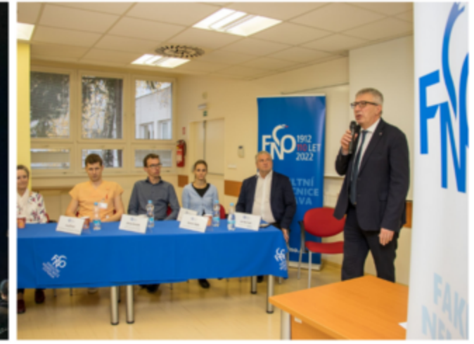
První pacientka po CAR-T léčbě

Lékaři pracují v rámci specializovaných týmů zaměřených na jednotlivé diagnózy: