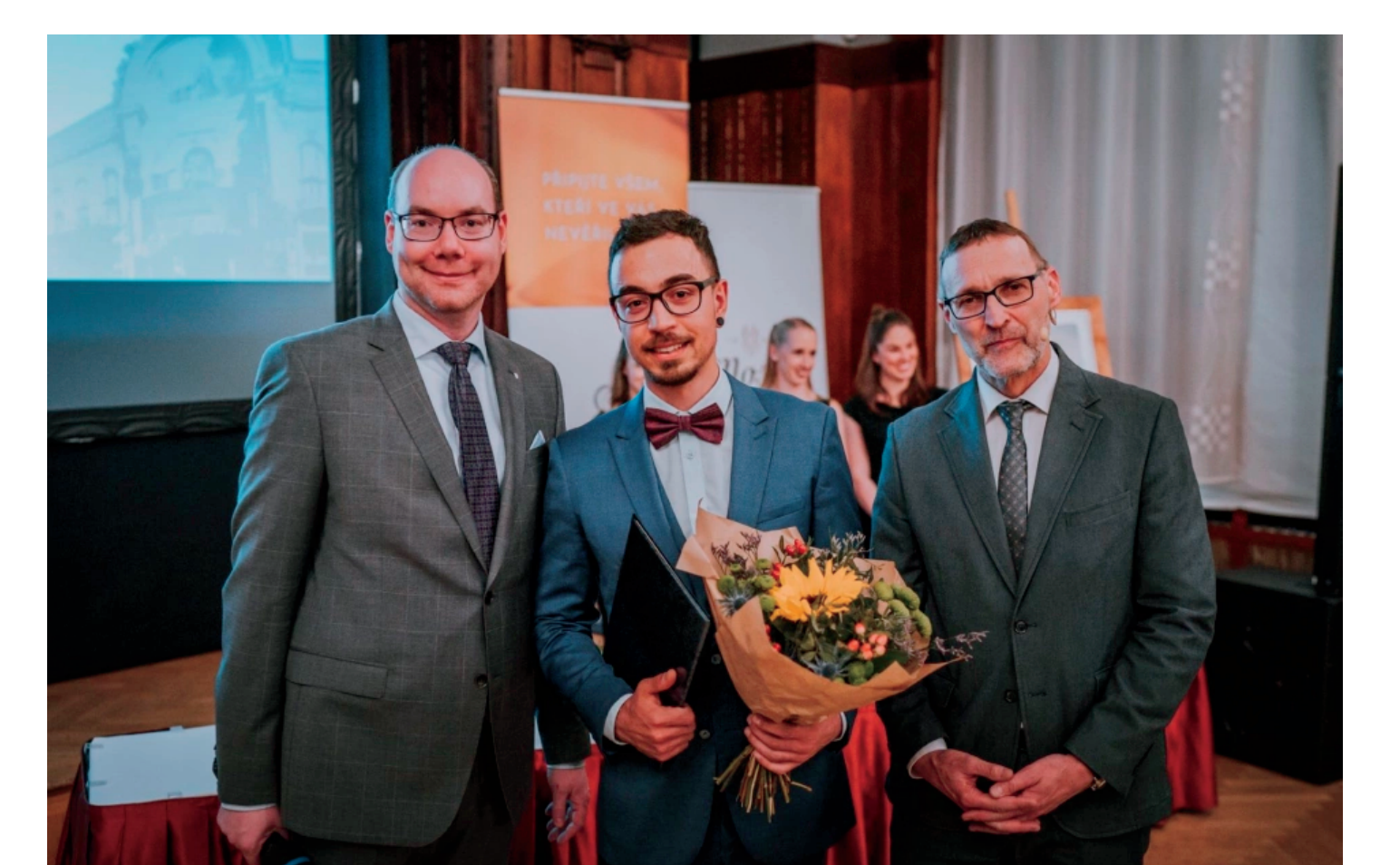
MUDr. O. Šušol získal stipendium od Nadace pro transplantace kostní dřeně