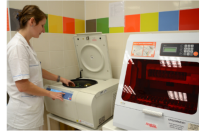
ZALOŽENÍ V ostravské fakultní nemocnici otevřeli první biobanku v kraji

Biobanka slouží k dlouhodobému uskladňování vzorků biologického materiálu pacientů, například krve, plazmy, séra, slin a dalších. Je společným projektem Fakultní nemocnice Ostrava a Lékařské fakulty Ostravské univerzity.