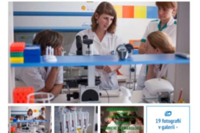
PRVNÍ BIOBANKA. K dlouhodobému uskladňování biologického materiálu pacientů bude sloužit historicky první biobanka v Moravskoslezském kraji.

Biobanka slouží k dlouhodobému uskladňování vzorků biologického materiálu pacientů, například krve, plazmy, séra, slin a dalších. Je společným projektem Fakultní nemocnice Ostrava a Lékařské fakulty Ostravské univerzity.